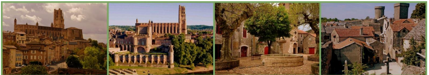
Albi, Sainte Eulalie de Cernon, La Couvertoirade

DIA 6 (10-10)– RODEZ – CIRCUITO DE LARZAC – ALBI – Após o café da manhã, saída para Albi, passando pelo circuito de Larzac (cidades templárias) passando por Sainte Eulalie de Cernon e Le Viala du pas de Jaux, visita a La Couvertoirade passeio a pé visitando os principais monumentos e a muralha da cidade. Almoço em La Couvertoirade (Almoço incluído). Após o almoço, saída para Albi com parada La Cavalerie. Chegada em Albi no fim da tarde.